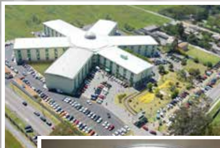
Estrutura e Profissionalismo

O carinho do acolhimento, com a segurança do profissionalismo.