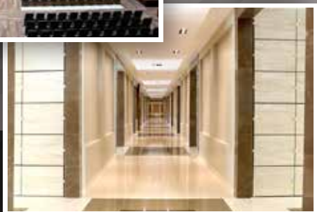
Segurança e Conforto