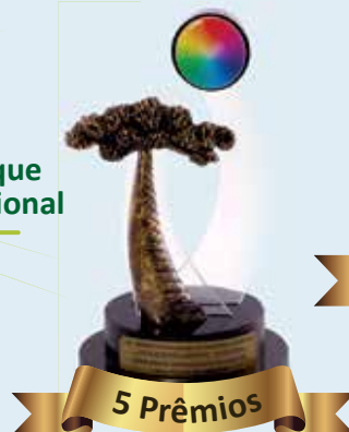
Paranaenses de Excelência Gráfica Oscar Schrappe Sobrinho

Um compromisso de papel passado, que envolve colaboradores, clientes e fornecedores com as melhores práticas de mercado. Ao receber o Prêmio Latino-Americano Theobaldo de Nigris 2016 como Gráfica Ouro , ingressamos definitivamente em um novo patamar que leva ao pé da letra o compromisso de imprimir ideias da forma mais primorosa do mercado.