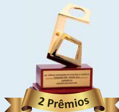
2 Prêmios Nacionais de Excelência Gráfica Fernando Pini

Omar Raymundo Picheth, 1200, Xaxim, Curitiba-PR