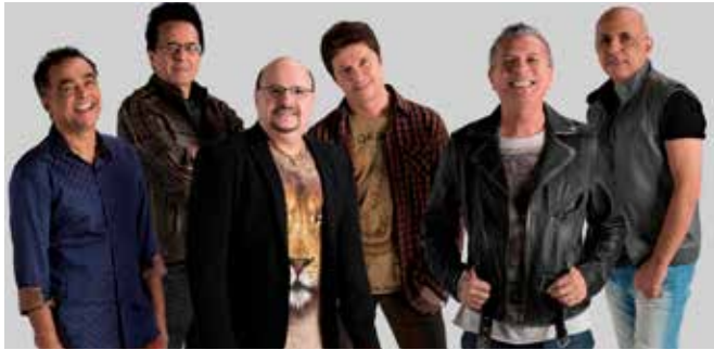
ROUPA NOVA ROUPACÚSTICO 2 (2006)

Roupa Nova encanta seus fãs desde a fundação da banda. Com vozes suaves que cantam o amor, cada álbum é um presente. Roupacústico Vol. 2, décimo nono álbum da carreira, veio para complementar o primeiro Roupacústico, lançado em 2004.