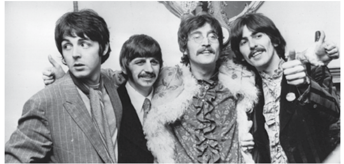
THE BEATLES MAGICAL MYSTERY TOUR (1967)

Assim como qualquer álbum lançado pela banda, você não vai se decepcionar com a qualidade musical e se encantará uma vez mais por Roupa Nova.