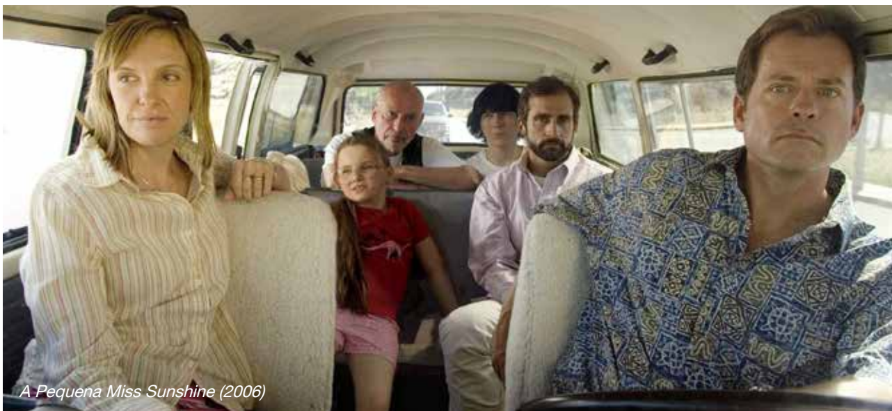
A Pequena Miss Sunshine (2006)