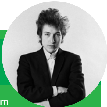
Bob Dylan Highway 61 Revisited (1965)

Este é o sexto álbum do cantor e compositor Bob Dylan. Esta foi a primeira vez que Dylan usou músicos do rock como sua banda de apoio em quase todas as faixas de um disco. Os críticos exaltam a forma inovadora na qual o músico dirige suas combinações, a base em blues , poesia, caos político e cultura da América Contemporânea. O álbum é conduzido pelo sucesso da canção Like a Rolling Stone , uma das músicas mais influentes de todos os tempos. Highway 61 Revisited é considerado um dos melhores discos da história da música e merece ser ouvido diversas vezes.